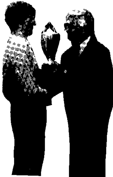
DE GJORDE DET SGU' - IGEN OG IGEN!

CSR's 20 årsjubilæumssæson - CSR lige med i slutspillet på en 4. plads, 3 forrygende gode kampe og 3 sejre. Ja, og det må vi jo nok indrømme; meget heldige indbyrdes resultater i de andre slutspils kampe, men vi HAVDE rutinen, viljen og troen. - Og så var CSR DM vindere 1990.